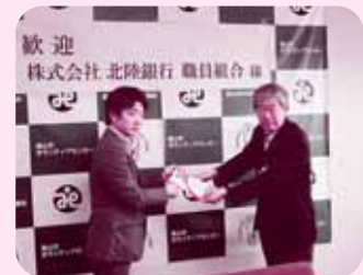
寄付される職員組合様(左)

平成29年5月18日(木)、株式会社北陸銀行職員組合様(富山市堤町通り1-2-26)が来訪されました。社内で開催された行事で募金活動を行い、「福祉事業のお役に役立てていただければ嬉しいです。」と赤い羽根共同募金に100,000円を寄付されました。