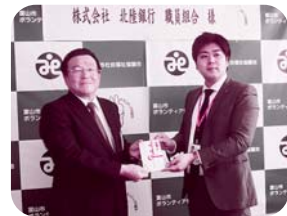
寄附される職員組合様(右)

平成28年4月27日(水)、株式会社北陸銀行職員組合様(富山市堤町通り1-2-26)が来訪されました。社内で開催された行事で募金活動を行い、「福祉事業のお役に立てて頂ければうれしいです。」と赤い羽根共同募金に40,000円を寄附されました。