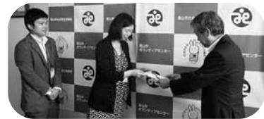
寄附される職員組合の方々(左)

平成27年5月15日(金)、株式会社 北陸銀行 職員組合様(富山市堤町通り1-2-26)が来訪されました。社内で開催された行事で募金活動を行ない、「福祉事業のお役に立てて頂ければうれしいです。」と赤い羽根共同募金に40,000円を寄附されました。