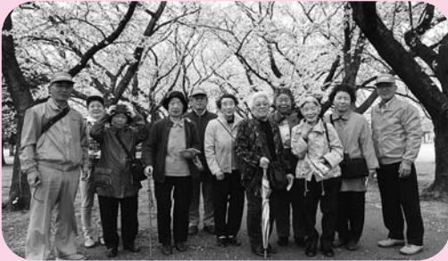
4月10日お花見とお買物の様子

山田地域社会福祉協議会では、公共交通の本数が限られ、不便を感じている高齢者の外出の機会を増やそうと、2年前から外出支援活動に取り組んでいます。昨年までは、パワーリハビリへの参加者の送迎だけでしたが、今年度からは日中ひとり暮らしとなる高齢者や高齢者世帯も含め、自力での外出が困難な方を対象に婦中、八尾、砺波へのお買い物支援を実施しています。現在、20名のボランティアが活動中です。外出することで、商品を選ぶ楽しみ、人とふれあう機会を増やし、ほどよい緊張感を持って、いつまでも健康でいていただくのが目的です。