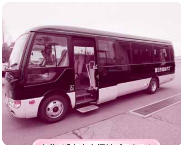
名称は「富山市福祉バス」です