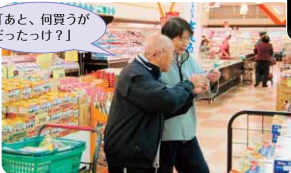
「あと、何買うが だったっけ？」