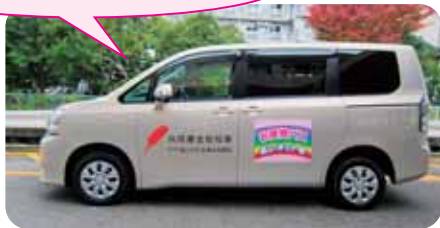
〔お買物バス「あいネット号」〕