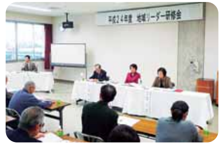
シンポジウムの様子

フリートークの時間には、会場からパネラーの皆さんにたくさんの質問が寄せられ、有意義な意見交換となりました。「他地区の状況がよくわかった」「今日聞いた内容を参考に組みたい」等の声が聞かれました。