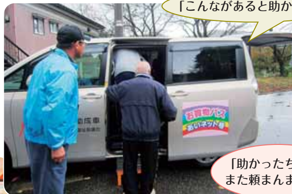
「助かったちゃ～また頼まんまいけ。」