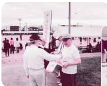
広田校下運動会にて

なお寄せられた募金は、富山県共同募金会を通じて児童福祉・障害者福祉・高齢者福祉の充実やボランティア活動の推進などに活用させていただきます。