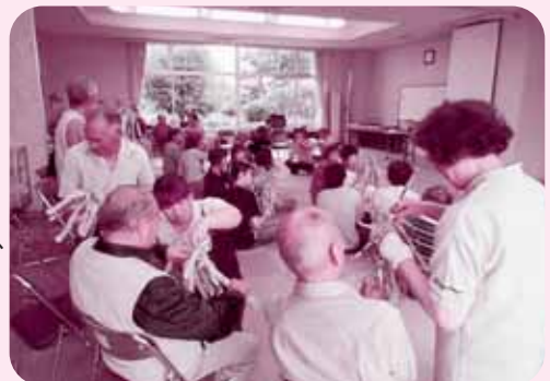
ボランティアと共に楽器作り

参加者は、新聞を使ったゲームや楽器を演奏したり歌ったりして和やかなひとときを過ごしました。