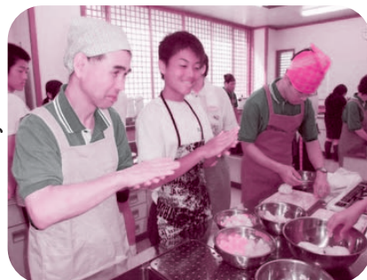
▲おやつ作りの様子

参加者は、はじめにボランティア活動について話しを聞いた後、NPO法人あさひ会あさがお事業所の利用者と一緒にレクリエーションで体を動かし、市食生活改善推進協議会八尾ブロックのみなさんの協力のもと、米粉を使ったおやつ作りなどで交流を深めました。参加者からは、「よい体験になった」、「ボランティア活動や福祉について理解が深まった」、「一緒におやつ作りをして楽しかった」などたくさんの感想が寄せられました。今後のボランティア活動の糧になるといいですね。