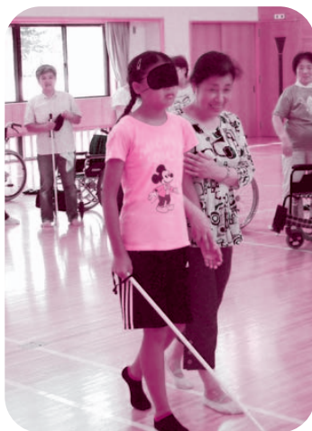
▲相手の立場に立った付き添い方

今後、古里地区社協の個人ボランティアとして登録を行い、当地区の地域福祉活動に活躍されます。