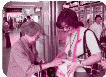
10月1日 富山駅前において街頭募金を呼びかける桜谷小学校他のみなさん