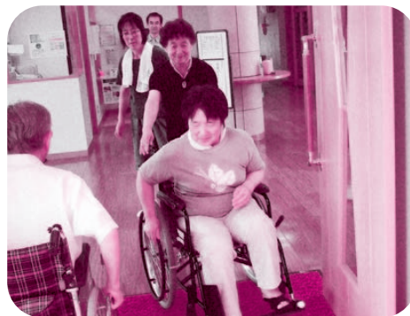
▲片麻痺の方を想定した車いすの操作