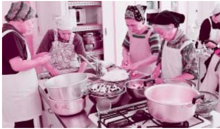
地域の給食ボランティア活動