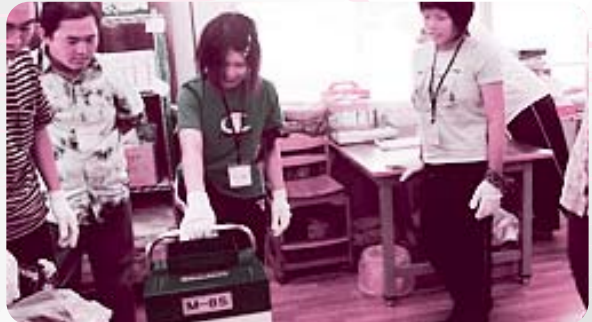
“よいしょ!!空き缶プレス体験”

参加した皆さんからは、「自分たちがボランティアとして参加したのに、障害者の皆さんにボランティアしてもらった」、「一方通行ではなく、お互いの心の交流ができ、障害への理解が深まった」など感想が寄せられました。