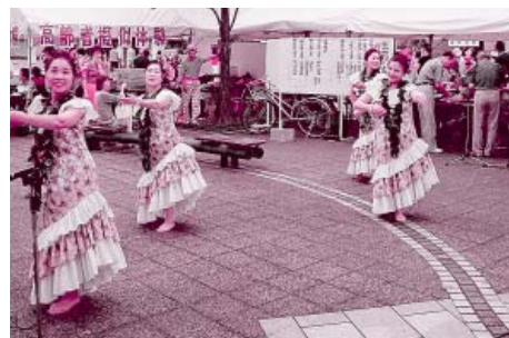
芸能ボランティアによるフラダンス

また、体験コーナーでは多くの親子連れや子どもたちが点字や手話など、レクリエーションコーナーではグランドゴルフなどを楽しみながら体験していました。