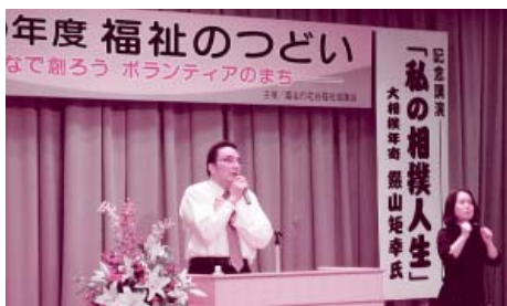
常に会場は笑い!! 失敗をバネに、熱く語られました。

10月5日(金)、八尾健康福祉総合センターにおいて『福祉のつどい』を開催しました。