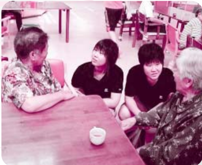
“利用者さんと交流を深めた楽しいひととき”

参加者からは、「たくさんの笑顔とありがとうの言葉をもらって元気になった」「進路選択の参考になった」「また来年もぜひ参加したいなど、活動感想文からは「参加してよかった」という気持ちが伝わってきました。