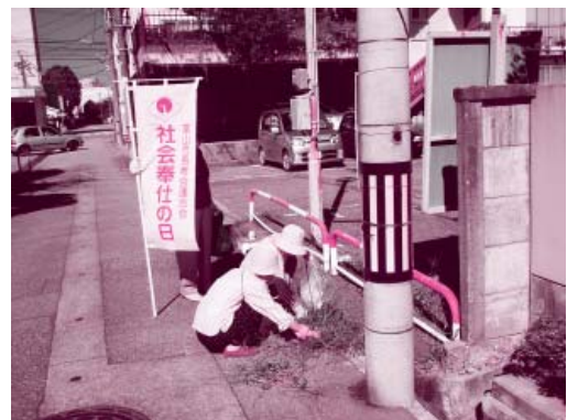
社会奉仕の日に活動される老人クラブのみなさん