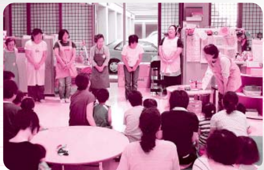
“ちょっと緊張しながら活動開始です”

受講者からは、「積極的に、子育て支援活動に参加したい」という力強い声が聞かれました。