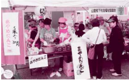
地区社協のイベント参加協力