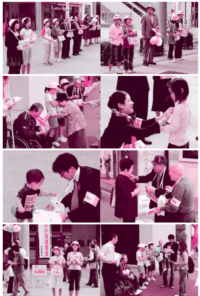
10月1日グランドプラザにて街頭募金を呼びかける柳町小学校のみなさんほか