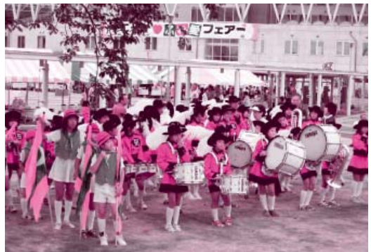
神通碧小学校による、マーチングバンド 「オープニングは、ほくらにおまかせ」

歌って健康づくりコーナーでは、歌謡グループ「セッション4!」による懐メロからジャズまでの歌謡ショーやお楽しみ抽選会などを行い、楽しい1日を過ごしました。