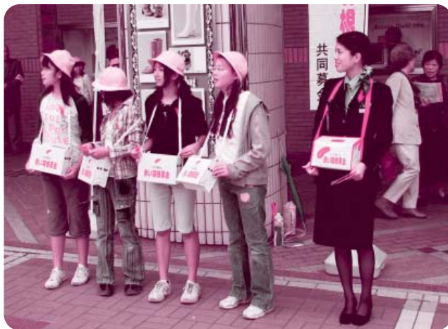
街頭募金に協力を呼びかける星井町五番町小学校のみなさん