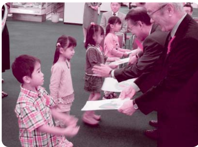
手作りのPR用ポスターを手わたす熊野幼稚園児のみなさん

だれもが住みなれた地域で安心して暮らすことができ、住民みずからが参加する福祉のまちづくりを実現するために、どうぞみなさまの温かいご理解とご協力を心からお願いします。