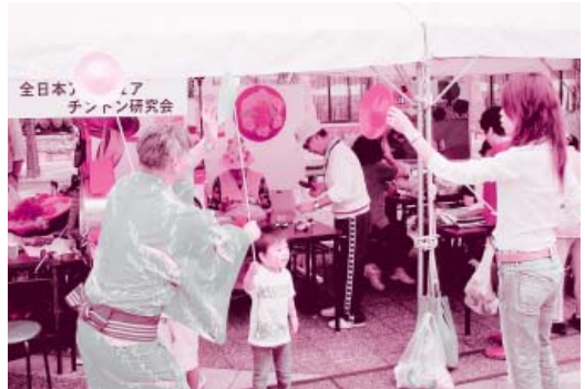
じょうずに回せるかな

また、体験コーナーでは多くの親子連れや子どもたちが点字や手話など、レクリエーションコーナーではグランドゴルフなどを楽しみながら体験していました。